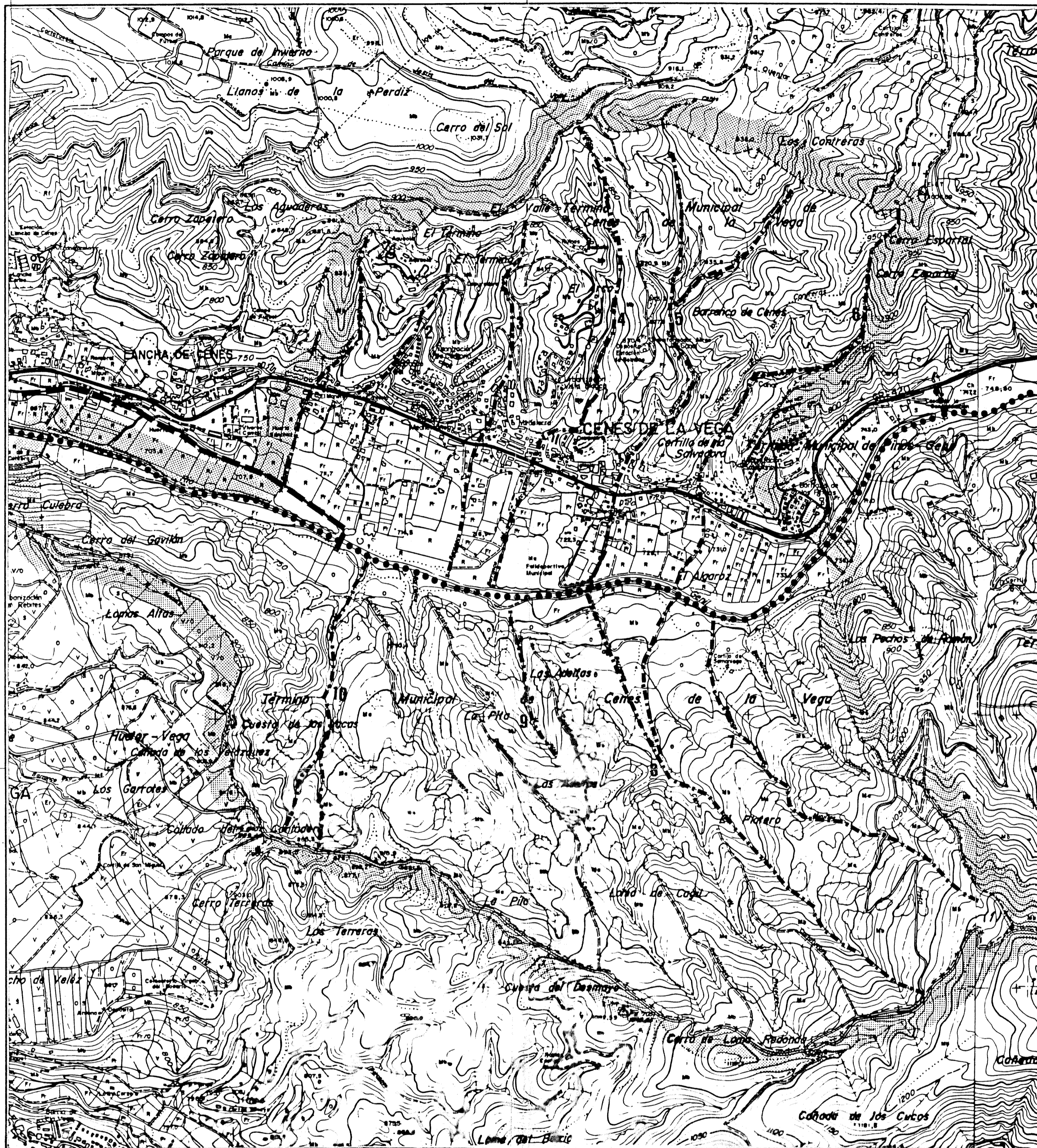
ELEMENTOS CARACTERÍSTICOS DEL TERRITORIO