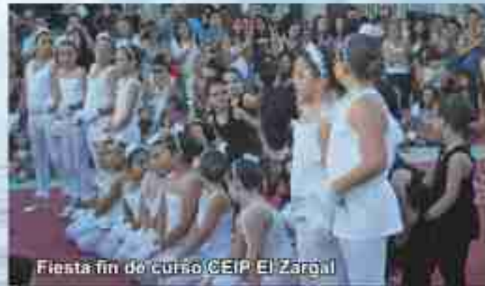
Fiesta fin de curso CEIP El Zagal