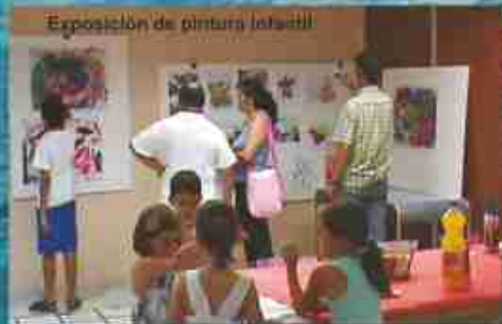
Exposición de pintura infantil