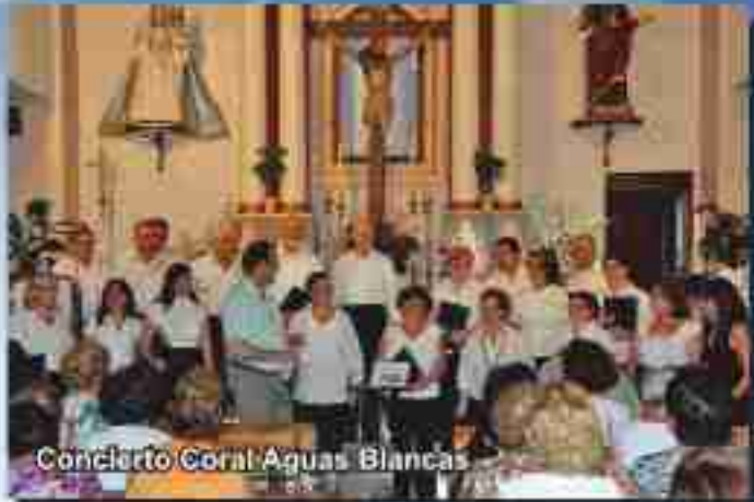
Concierto Coral Aguas Blancas