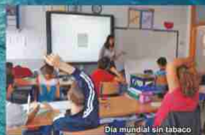
Día mundial sin tabaco