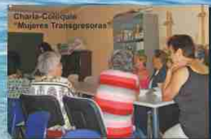
Charla-Cólligue "Mujeres Transgresoras"