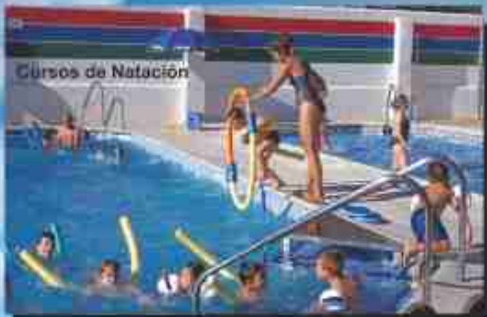
Cursos de Natación